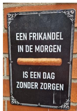
Bordje bij snackbar Roermond

We zitten nu toch behoorlijk vol en we moeten gaan uitbuiken. En dan komt er ook nog een machtig dessert; Limburgse rijstevlaai met kersen en koffie met Mergelblökskes. We horen op veel plekken in de organisatie en ook bij samenwerkingspartners dat Wonen Zuid veel ballen in de lucht houdt. Dat geldt voor binnen de organisatie en dat verhoogt de werkdruk. En hiervoor wordt de samenwerking met andere partijen stroperig. De medewerkers verdelen hun energie over teveel gerechten en dan koelen gerechten af, die dan niet meer vers op tafel komen. Dat is zonde. We krijgen ineens het gevoel in een aflevering van Oorlog in de keuken! van Gordon Ramsey te zitten. Zijn advies is altijd: beperk de menukaart tot een paar gerechten die je echt goed kunt maken. En gebruik bij die gerechten een paar verse ingrediënten, die complementair aan elkaar zijn. En presenteer het gerecht aantrekkelijk. Liever een menu met een patatje met van Vlaamse friet, frikandel en verse salade dan een all-you-can-eat menu.