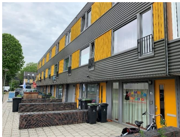
Foto van opgeknapte woon-werk-woningen in de wijk Donderberg in Roermond.