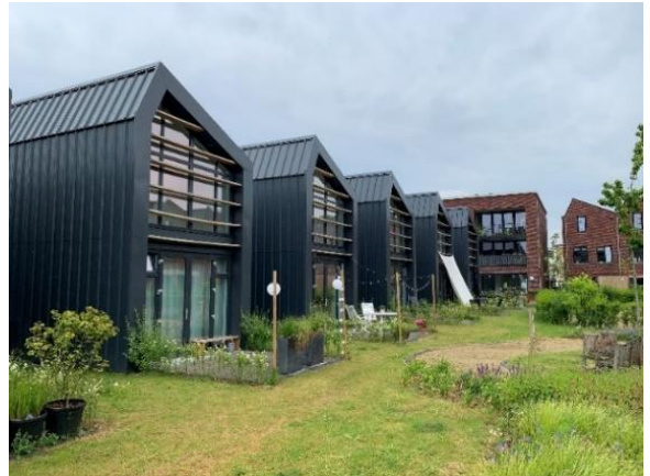
Foto van 'Area-M' met de tiny houses en de gezinswoningen.

In 2021 heeft Wonen Zuid een bijzonder project opgeleverd in Roermond. Op het voormalige Campinaterrein zijn 42 woningen opgeleverd bestaande uit appartementen, gezinswoningen en tiny houses. Het bijzondere aan dit project is dat het gehele plan is ontworpen in samenwerking met een community van potentieel toekomstige bewoners en een architect. In twee tot drie jaar (corona)tijd hebben de destijds toekomstige bewoners plattegronden geknipt en geplakt, materialen gekozen en gerekend om iets unieks te creëren. De woningen zijn zo ontworpen dat deze een industriële uitstraling hebben en passen in de omgeving. De community die woont in Area-M kenmerkt zich als een ondernemende, creatieve en avontuurlijke gemeenschap. Er is een gemeenschappelijke ruimte voor ontmoeting en dat versterkt het sociale netwerk. Dit project is genomineerd geweest voor MDG architectuurprijs 2022 en heeft landelijke pers aandacht genoten. Het is voor collega-corporaties een trekker om te zien hoe gewerkt kan worden aan bewonersparticipatie en hoe een community de sociale binding en leefbaarheid kan stimuleren in een buurt.