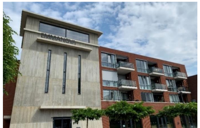
Foto van 'Emma Nova' waarin 30 appartementen en maatschappelijke voorzieningen zijn gerealiseerd.

Treebeek in Brunssum is een voormalige en traditionele mijnwerkerswijk. Hier staan nog authentieke mijnwerkerswoningen gecombineerd met moderne architectuur, een groene omgeving en veel ruimte voor participatie en ontmoeting. Om de woningkwaliteit in deze buurt te garanderen, heeft Wonen Zuid aan het Treebeekplein 96 woningen gesloopt en vervangen door 48 duurzame en eigentijdse sociale huurwoningen. Het betreft een mix van verschillende woontypen: het zijn zowel gezinswoningen als levensloopbestendige woningen. Hierdoor komen ook hoogteverschillen tussen woningen terug die karakteristiek zijn voor de vroegere architectuur van de mijnwerkerskoloniën. Aan het Orionplein heeft Wonen Zuid 30 huurappartementen gerealiseerd boven een activiteitscentrum. Het gebouw heeft een bijzondere architectuur: het is een replica van Schacht III van de Staatsmijn Emma. De naam van het gebouw 'Emma Nova' verwijst naar het mijnverleden. Tijdens de sloop zijn bijna alle bruikbare materialen hergebruikt en/of verkocht aan buurtbewoners tijdens een 'materialenmarkt' in de wijk.