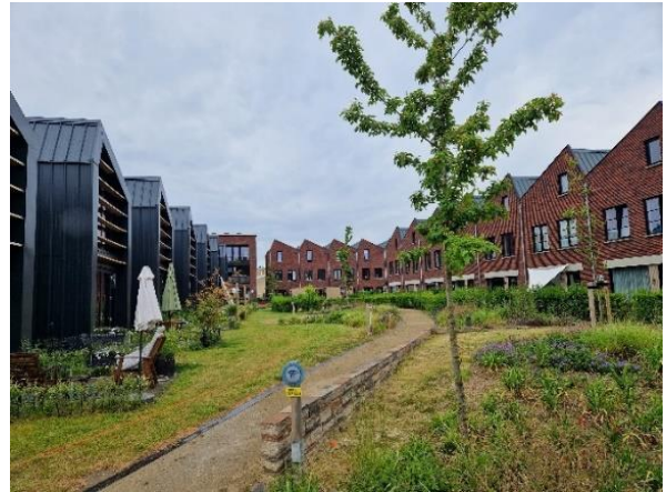
Area-M in Roermond

Toekomstige bewoners hebben bij het ontwerp van hun wijk Area-M in Roermond geparticipeerd om zo samen de woningen, de gezamenlijke ruimte en de binnentuin te ontwerpen. Deelnemers kregen extra punten, die ze kansrijker maakten bij de toewijzing van de woningen. De visitatiecommissie heeft Area-M bezocht en was onder de indruk van het sociale weefsel dat in deze wijk is ontstaan en dat is zichtbaar in een wij-gevoel en tiptop onderhoud van de binnentuin. Deze vorm van gebiedsontwikkeling krijgt opvolging in andere steden. Zo zagen wij onlangs een studie van een wijk in Almere waarbij Area-M als bijzonder voorbeeld van collectief particulier opdrachtgeverschap is gepresenteerd. Wonen Zuid toont lef en neemt risico's. Ze werken vanuit de bedoeling van sociale woningbouw. Dat is ingegeven door hun werkstijl. Deze twee voorgerechtigtes zijn zeer smaakvol en andere corporaties kunnen hiervan van leren.