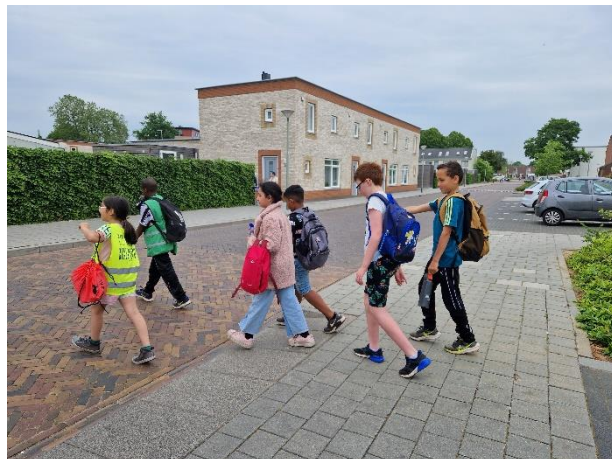
Foto van kinderen in de wijk Donderberg in Roermond.

Betrokken zijn houdt in dat Wonen Zuid actief is in de omgeving. Wonen Zuid zet zich in op leefbaarheid en het stimuleren van (huurders)participatie. Het houdt ook in dat Wonen Zuid intern en extern naar elkaar omkijkt en ervoor zorgt dat de dienstverlening op orde is. In elke activiteit die de corporatie uitvoert wordt besproken hoe de waarden betrouwbaar en betrokkenheid terugkomen. Dat richt de corporatie samen in zodat elke medewerker deze waarden kan uitstralen richting huurders en andere samenwerkingspartners. Zodoende is elke werknemer uit de organisatie op zijn manier betrokken.