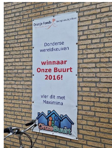
Foto wijkcentrum Maximina Roermond

Aandachtspunt is nog de vele projecten om de organisatie verder te brengen die wel opgestart worden, maar geen vervolg krijgen. De visitatiecommissie is ervan overtuigd dat met een scherpere selectie van beleidstrajecten en minder projecten er met meer focus betere resultaten worden geboekt.