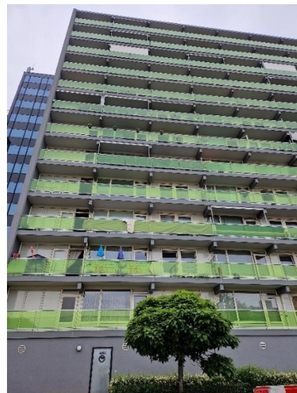
Foto Componistenbuurt Roermond

Met de komst van de nieuwe bestuurder moeten kansen worden gecreëerd en benut; de extern belanghebbenden geven aan hier hoge verwachtingen van te hebben. Tegelijkertijd kan dan gewerkt worden aan de invulling van de eigen wens om initiatiefnemer en regievoerder te zijn; dat is nog onvoldoende van de grond gekomen. Het momentum om met belanghebbenden een gezamenlijke visie op samenwerking handen en voeten te geven is daar. Daarbij is een visie op zorg en welzijn voor de gemengde wijken een eerste stap. De visitatiecommissie geeft Wonen Zuid met klem mee dit momentum niet onbenut voorbij te laten gaan.